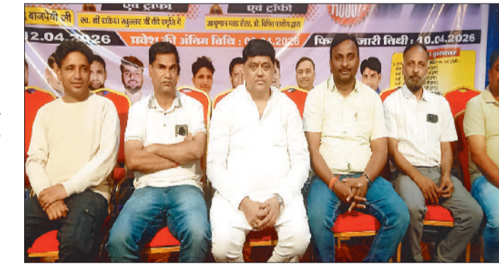
पत्रकारों से चर्चा करते प्रायोजकगण।

नगर के भालेराय खेल मैदान में आगामी 12 अप्रैल से डी.बी. वेंचर्स गोल्ड कप 2026 क्रिकेट टूर्नामेंट का भव्य शुभारंभ होगा। डी.बी. वेंचर्स गोल्ड कप चांपा 2026 के तहत फ्लड लाइट ओपन टेनिस बॉल क्रिकेट टूर्नामेंट का