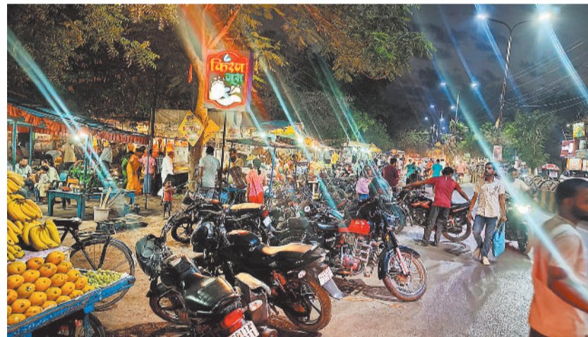
जांजगीर-चांपा। जिला बनने के दो दशक बाद भी जिला मुख्यालय जांजगीर में पार्किंग की सुविधा व्यवस्था नहीं हो पाई है। सड़क किनारे दुकान और टेले खोमचे लग रहे हैं। ऐसे में सड़क पर ही वाहनों की पार्किंग की जा रही है। इस स्थिति में ट्रैफिक जाम और आवागमन की समस्या आम हो गई है।