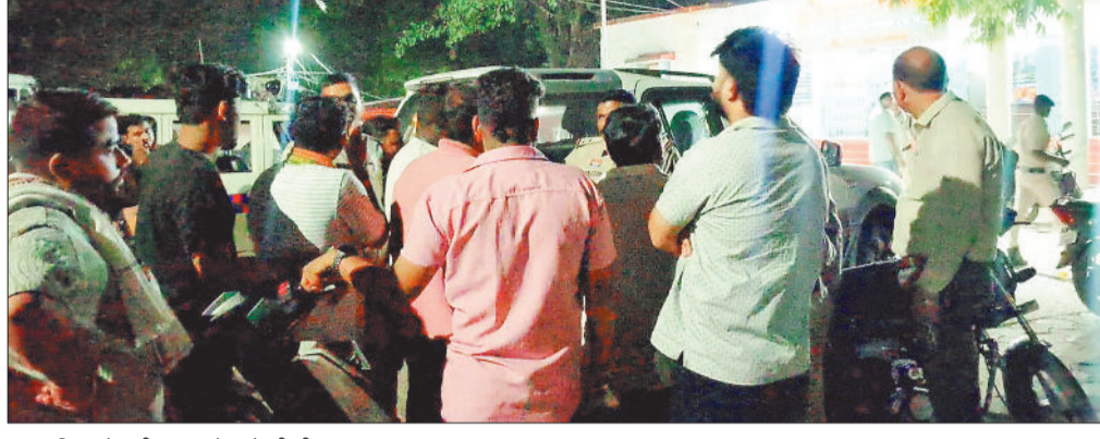
थाना परिसर में लगी भाजपा नेताओं की भीड़।

प्राप्त जानकारी के अनुसार पुलिस द्वारा मोटर व्हीकल एक्ट के तहत नियमित जांच अभियान चलाया जा रहा था। इसी दौरान नियमों का उल्लंघन पाए जाने पर एक युवक की मोटरसाइकिल का चालान किया गया। चालान कटते ही संबन्धित युवक के भाजपा कार्यकर्ता होने की बात सामने आई, जिसके बाद भाजपा नेता व कार्यकर्ता एकजुट होकर थाना पहुंच गए और कार्रवाई पर आपत्ति जताने लगे। प्रत्यक्षदर्शियों के अनुसार थाना परिसर में कुछ समय तक हालात बेहद तनावपूर्ण बने रहे। पुलिस अधिकारियों ने संयम