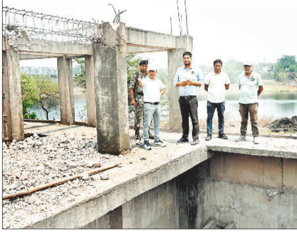
हसदेव नदी के पास निर्माणधीन वॉटर ट्रीटमेंट प्लांट का निरीक्षण कर निर्देश देते कलेक्टर

जिला मुख्यालय जांजगीर में जिला बनने के दो दशक बाद भी नल से घरों में पानी सप्लाई का इंतजाम नहीं हो सका है। जल आवर्धन योजना का 2 साल का प्रोजेक्ट 9 साल बाद भी अधूरा पड़ा है। जांजगीर नैला नगर पालिका प्रशासन ने घर-घर पानी पहुंचाने के लिए साल 2017 में 35 करोड़ की लागत से जल आवर्धन योजना में काम शुरू किया था। टेकेदार को कार्य पूर्ण करने के लिए तब 2 साल का समय दिया गया था, लेकिन काम में लगातार देरी होती गई। कई बार एक्सटेंशन देने के बाद भी टेकेदार की लापरवाही के कारण 9 साल में महज 70 फीसदी ही काम हो सका है। काम में लेटलतफी के कारण टेकेदार का टेंडर पूर्व में ही