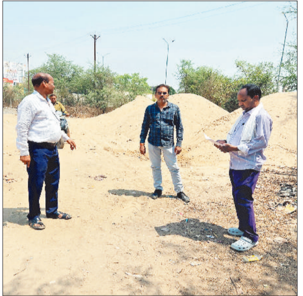
बस स्टैंड के पास डंप रेत को जप्त करते अधिकारी।