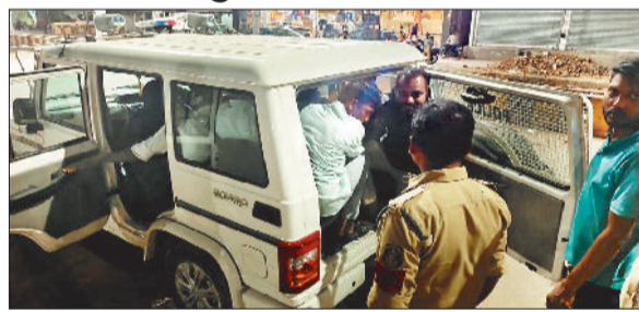
आरोपियों को पकड़कर थाने ले जाती पुलिस।